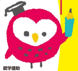
就学援助 イメージキャラクター ツクロウくん

学校教育法などにもとづいて、小中学校の子どもがいる家庭に学用品費や学校給食費などを市町村が援助する制度です。子どもたちの安心で楽しい学校生活のために、気軽に就学援助制度を活用してみませんか。